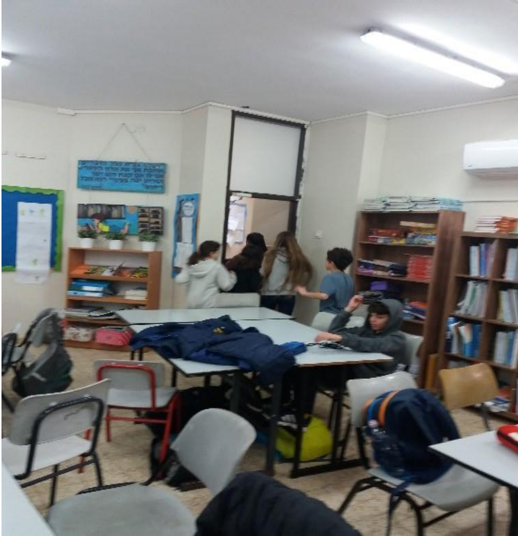
מליאה- סיכום השיעור (7): דקות)